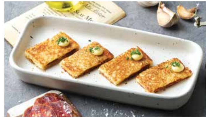
CHORIZO BIKINI SANDWICH 290THB

Hand Cut Iberico Jamon With Tomato Sourdough Bread.