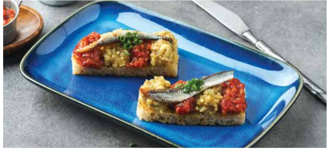
ESCALIVADA WITH SMOKED SPANISH ANCHOVY 290THB

Toasted Sourdough Bread with Grated Tomatoes, drizzled with Extra Virgin Olive Oil and Salt Flakes.