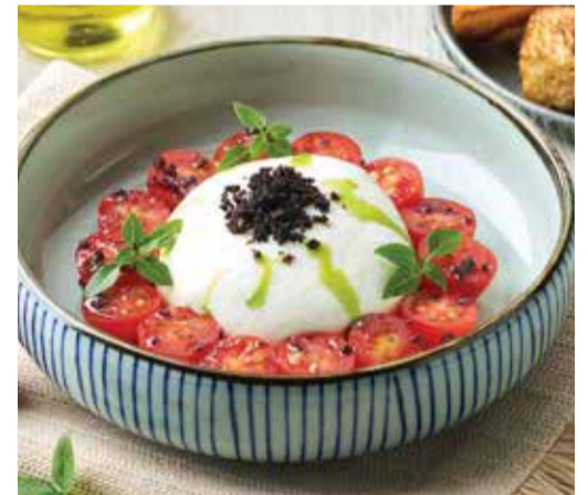
BURRATA & CHERRY 570THB TOMATO SALAD

A fresh mix of seasonal greens tossed in a house-made nuts berry vinaigrette.