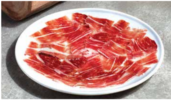
JAMÓN IBÉRICO 1,410THB/60gm 790THB/30gm

Selection of Artisanal Cheeses and Premium Spanish Cold Cuts with Grilled Grapes, Dried Apricots and Pear Marmalade.