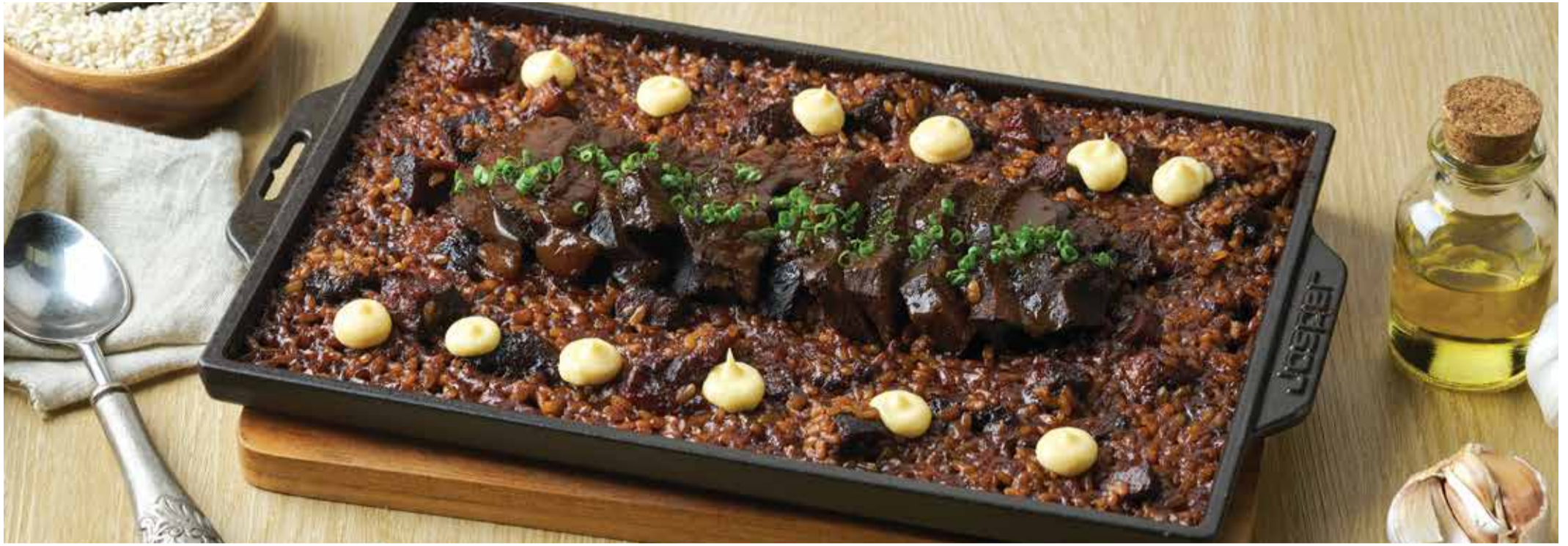
BEEF PAELLA A LA LLAUNA L: 1,550THB M: 890THB ปาเอญ่าอัลยาวน่าแก้มวัวตุ๋นไวน์แดง 20 Hours Slow Cooked Beef Cheek Paella.