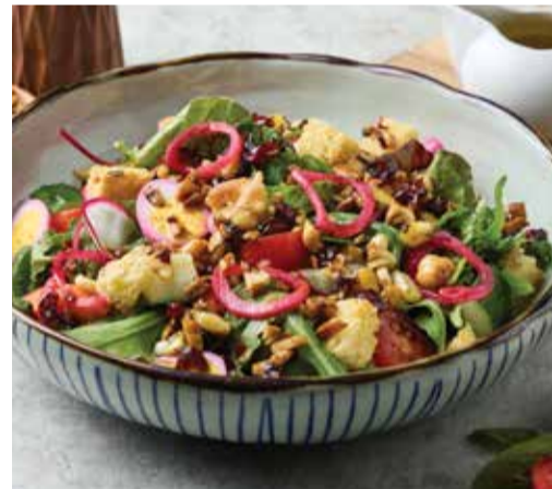
HOUSE GARDEN 320THB SALAD

Grilled Caesar Salad topped with Crispy Chorizo Bites and Smoked Spanish Anchovies.