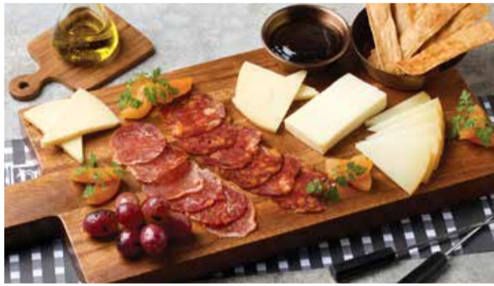
CHEESE & IBERICO PLATTER 850THB

Toasted Focaccia Layered with Baked Capsicum and Aubergine, topped with Smoked Anchovy from Spain.