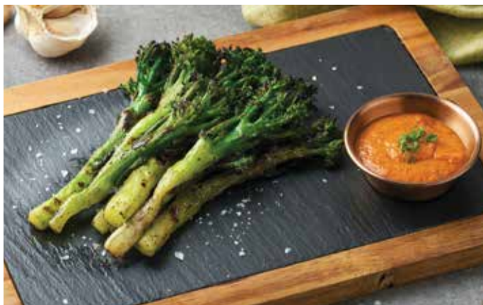
GRILLED BROCCOLINI 250THB

Charcoal Seared Cauliflower served with Creamy Beetroot Hummus.