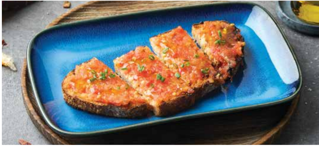
FRESH TOMATO SOURDOUGH BREAD 120THB

With tomato spread and assorted deli meats!