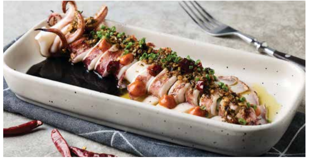
GRILLED WHOLE SQUID 690THB

แซลมอนย่างเสิร์ฟคู่กับสลัดเฟนเนลและซอสครีมหน่อไม้ฝรั่ง Salmon Grilled in our Jospier® Oven with Fresh Fennel Salad and a Creamy Asparagus Sauce.