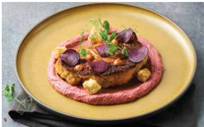
CAULIFLOWER STEAK 350THB

ดอกกะหล่ำย่างปาร์ก้าเสิร์ฟกับฮัมมัสบีทรูท