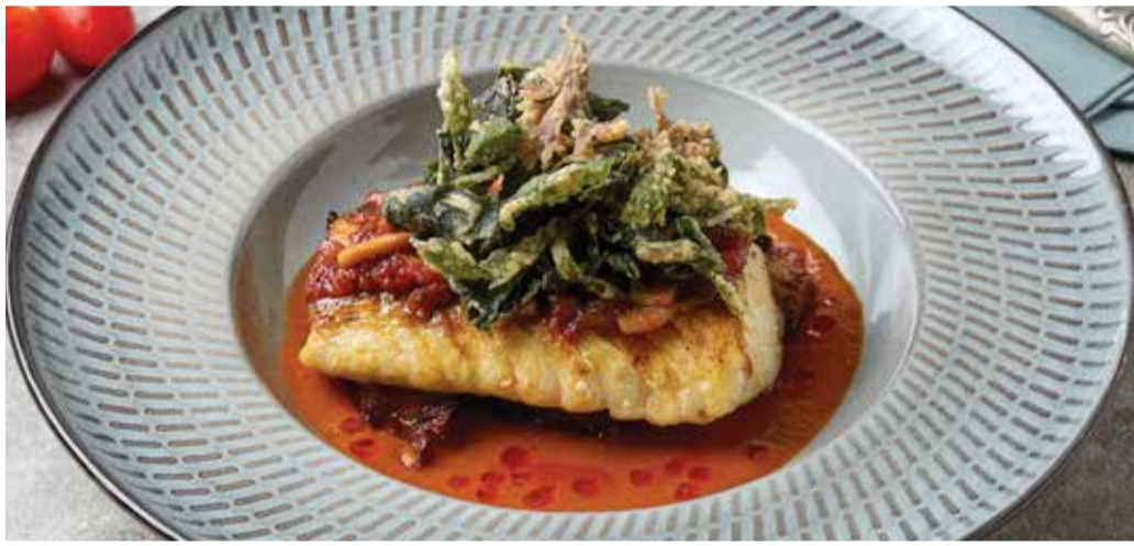
SMOKY ATLANTIC COD 790THB

ปลาหมึกคอกอย่าง เสิร์ฟพร้อมซอสหมึกดำ Mitre squid, Grilled Whole in the Jospier® Oven. Served with a rich Squid Ink Sauce and Aromatic Garlic.