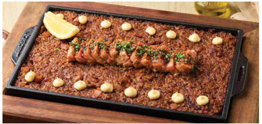
SALMON PAELLA A LA LLAUNA L: 1,290THB M: 790THB ปาเอญ่าอัลยาวน่ากับแซลม่อนทาทากิ Salmon Tataki With Seafood Rice and Furikake Aioli.