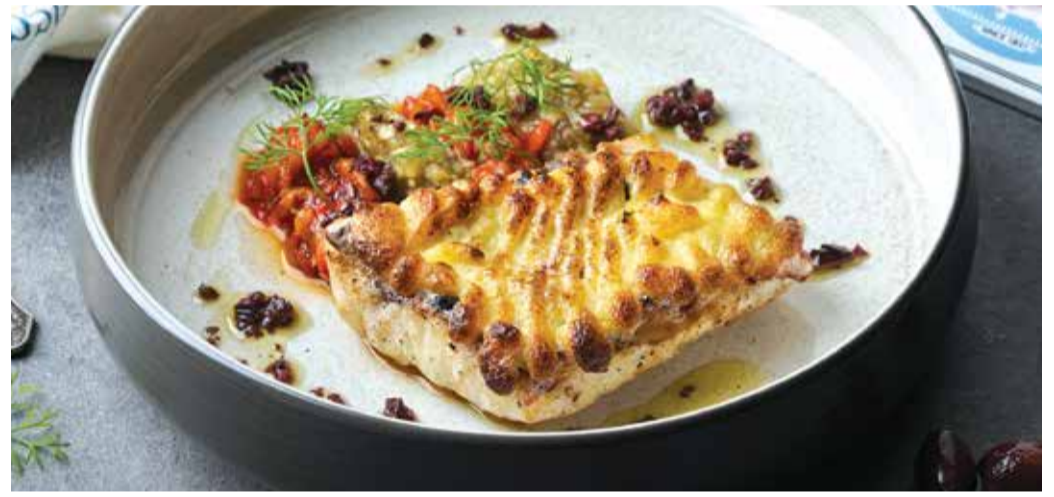
RED SNAPPER WITH ALIOLI GRATIN 570THB

ปลาเคียดแอตแลนติกย่าง เสิร์ฟคู่ซอสซีฟู้ดสเปน Atlantic Cod, Grilled in the Jospier® Oven, paired with Red Seafood Sauce.