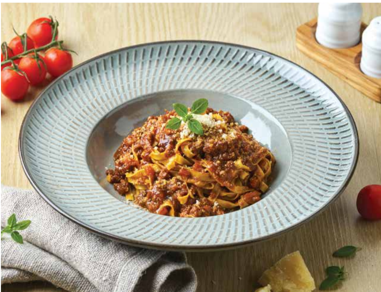
TAGLIATELLE BOLOGNESE 490THB แทลลียีเทลโลมเบตโบลอนเนสเนื้อ Tagliatelle with Home Made Bolognese Sauce topped with Freshly Grated Parmesan Cheese.