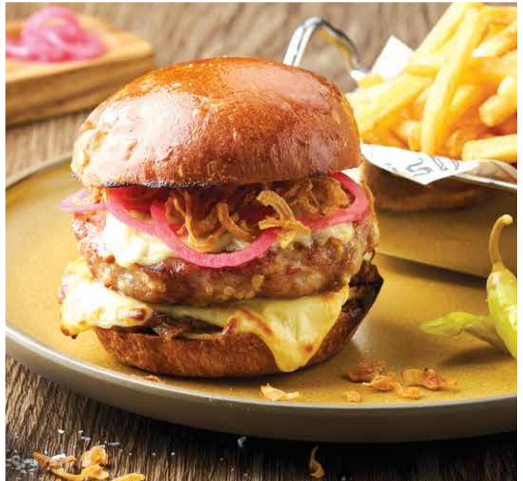
PORK BURGER 490THB

ชีสเบอร์เกอร์เนื้อวากิว Grilled Wagyu Beef Patty topped with Smoky Jospier® Onions and Cheddar Cheese.