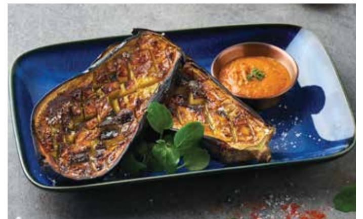
BAKED AUBERGINE 280THB

Smoky Grilled Broccolini with Romesco Sauce.