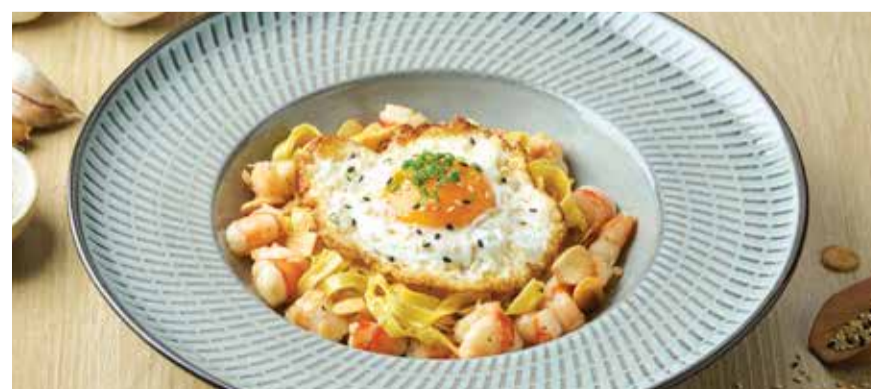
TAGLIATELLE AL AJILLO 480THB แทลลียีเทลโลอาคิโย่กึ่งกระเทียมและโห้ดาวออร์แกนิก Tagliatelle Sautéed with Prawns, Aromatic Garlic and a touch of Chilly Flakes, topped with a Sunny Side Up Egg.