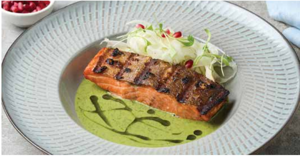
GRILLED SALMON WITH FENNEL SAUCE AND ASPARAGUS 490THB

แซลมอนย่างเสิร์ฟคู่กับสลัดเฟนเนลและซอสครีมหน่อไม้ฝรั่ง Salmon Grilled in our Jospier® Oven with Fresh Fennel Salad and a Creamy Asparagus Sauce.