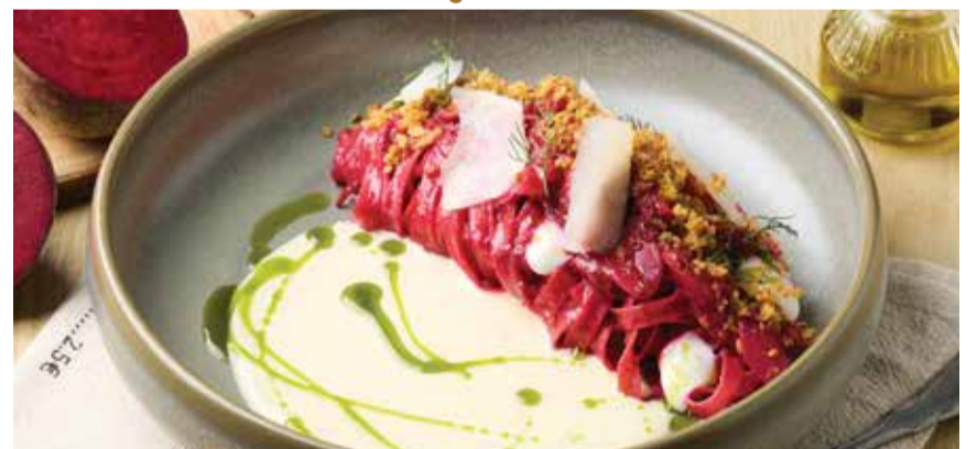
BEETROOT TAGLIATELLE MANCHEGO 400THB แทลลียีเทลโลในซอสบีตรูทกับซอสแมนเชโกชีส Tagliatelle tossed in Beetroot Sauce, finished with Manchego Cream.