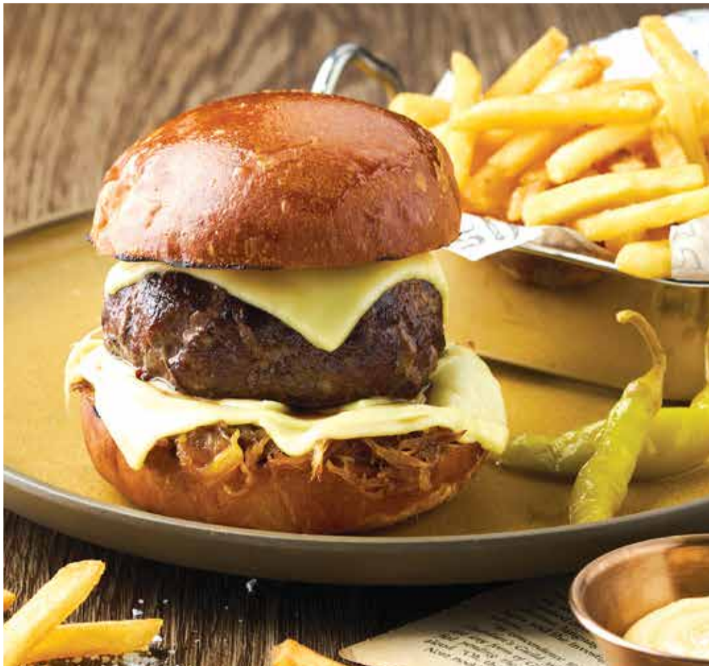
WAGYU BEEF BURGER 690THB

JUICY, SAVORY, AND STACKED TO PERFECTION!