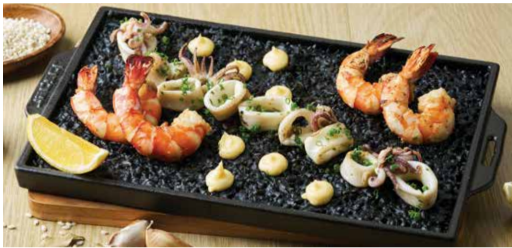
SQUID INK PAELLA A LA LLAUNA L: 1,550THB M: 890THB ปาเอญ่าอัลยาวน่าหมึกดำซีฟู้ด Black Seafood Rice with Squid Ink.