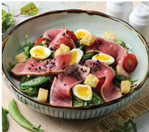
GRILLED NIÇOISE 380THB WITH SEARED TUNA

THE HEALTHY OPTION, PERFECT FOR SHARING..