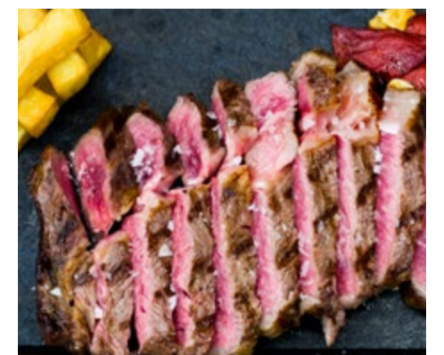
Llom de Wagyu Llom de Wagyu sense os

El Wagyu és una raça de bestiar d'origen japonès d'un alt valor gastronòmic, gràcies fonamentalment, al seu "Shashi" o infiltració de greix.