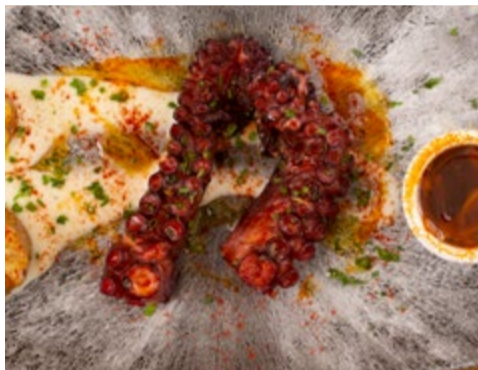
Pop a la brasa