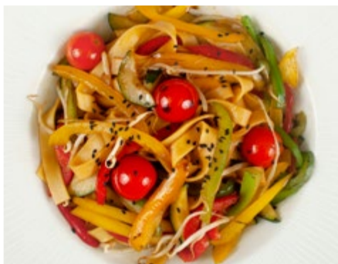
Wok de tagliatelle