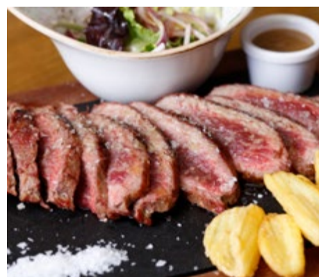
Presca de porc ibèric de gla