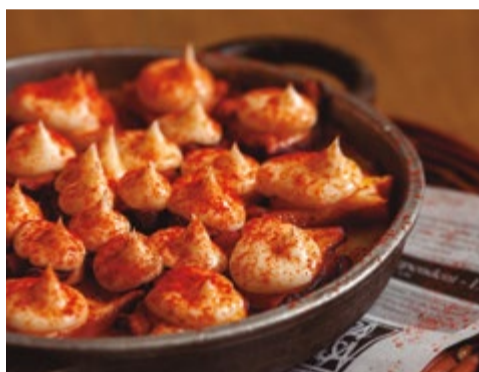
Cassoleta de pop