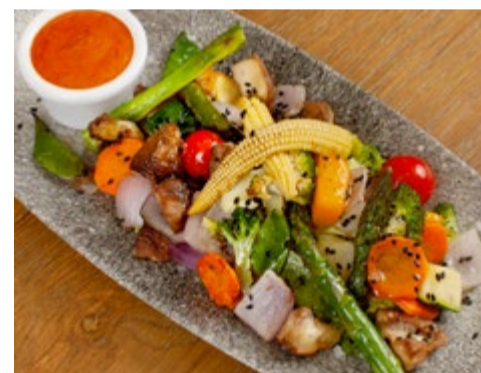
Crudités de verdures