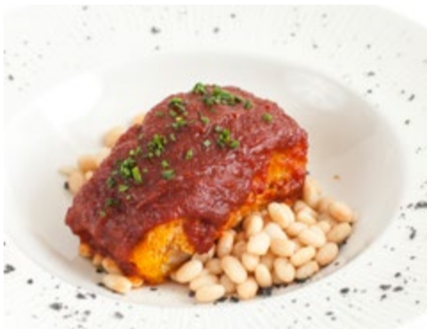
Morro de bacallà a la llauna