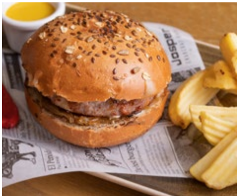
Hamburguesa de pagès