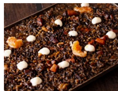
Arròs negre a la llauna