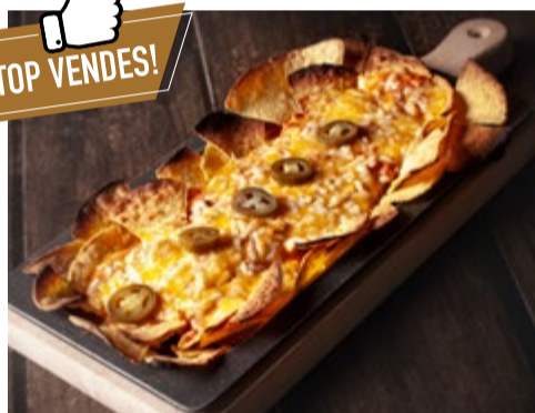
"Nachos" a la brasa