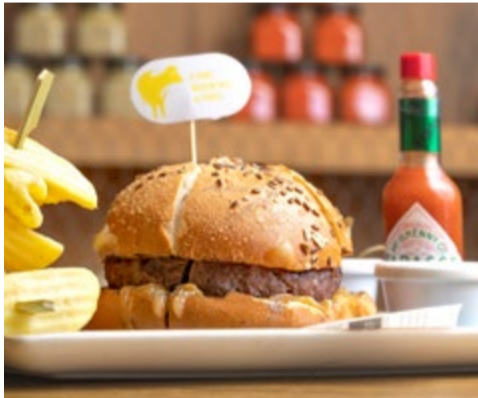
Hamburguesa prèmium 100% raça Wagyu