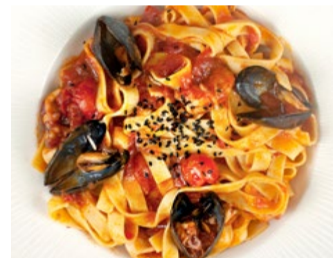
Tagliatelle al frutti di mare