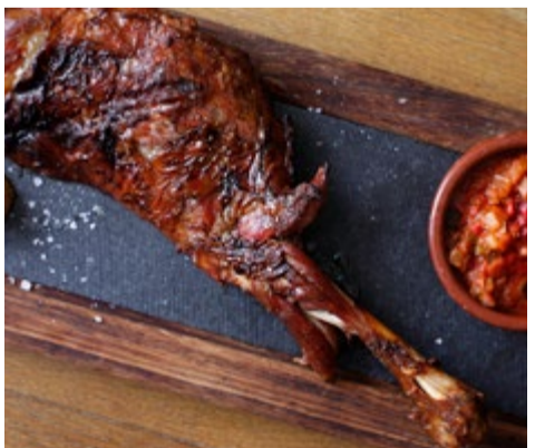
Espatlla de xai