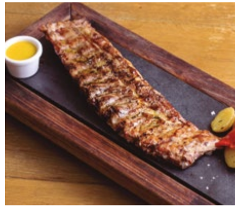
Costellam de porc