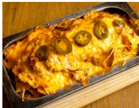
Nachos a la brasa 10,50 Con carne picada, tomate, jalapeños y queso fundido