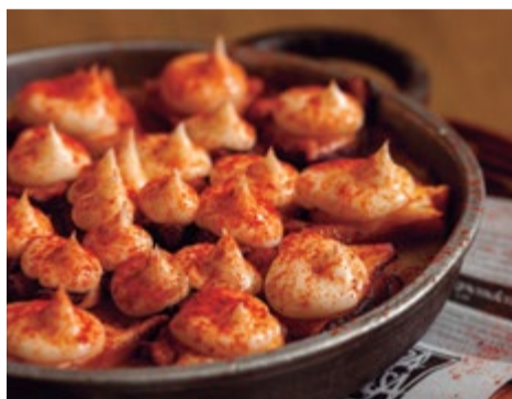
Cazuelita de pulpo 14,90 Con una muselina de "allioli" y base de puré de patata