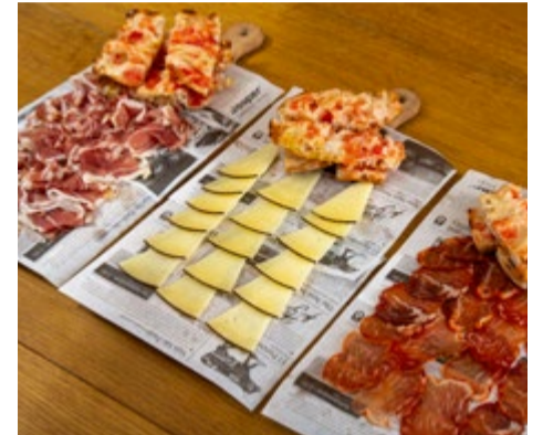
Medias tablas Jamón ibérico, lomo ibérico y queso de oveja