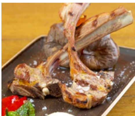
Costillas de cordero 7,50 / u. En esta casa solo se vende costilla de palo, ¿Cuántas quiere?