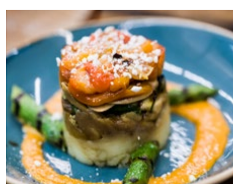
Timbal de verduras 9,75 A la brasa con queso de cabra (o sin)