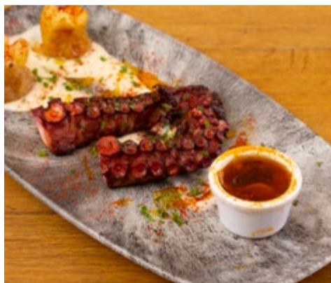
Pulpo a la brasa 22,25 Sobre parmentier trufado de patata y pimentón de la Vera