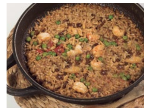
Arroz al carbón 15,25 / pers. Paella señorito a la brasa