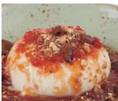
Ensalada de Burrata 14,60 200 g del corazón de la mejor mozzarella de búfala