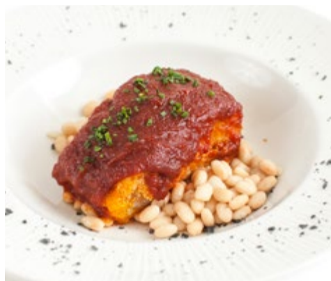
Lomo de bacalao "a la llauna" 19,75 Salteado con ajo, guindilla y tomate