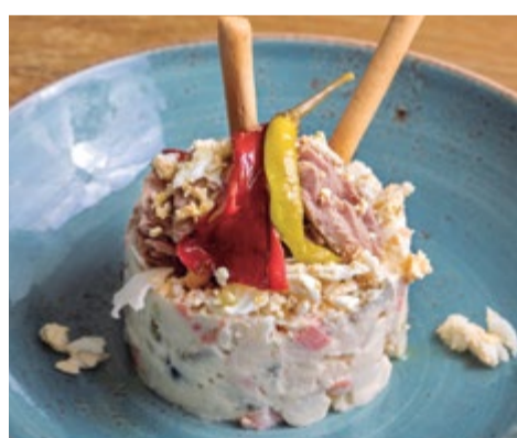
Ensaladilla rusa 7,75 Deliciosa ensaladilla rusa tradicional