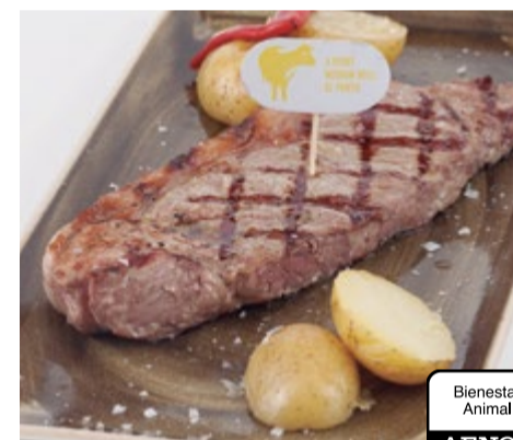
Entrecot a la brasa 19,95 Entrecot a la brasa ternera dos primaveras (suplemento salsa a la pimienta o al roquefort 1€)