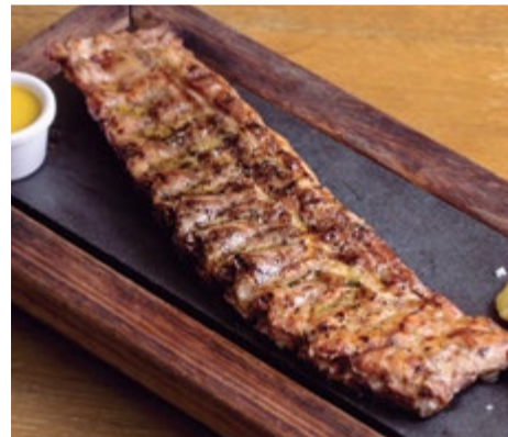
Costillar de cerdo 17,75 E dos cocciones: a baja temperatura durante 20h a 75° y finalizado a 400° al Josper®