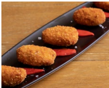
Croquetas caseras 8,60 Nuestras croquetas caseras de pollo y jamón