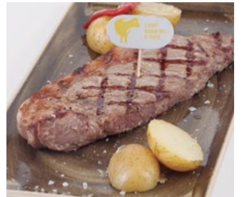
Entrecot a la brasa 16,50 (suplemento salsa a la pimienta o al roquefort 1€)