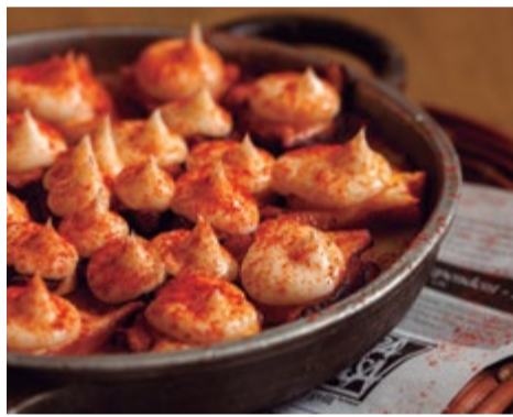
Cazuelita de pulpo 12,50 Con una muselina de "allioli" y base de puré de patata