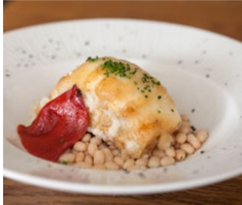
Lomo de bacalao con "allioli" 14,50 A la brasa con judías blancas y gratinado con "allioli"