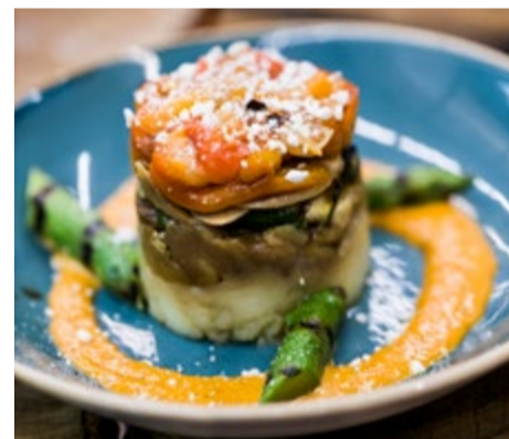
Timbal de verduras a la brasa 9,25 Con queso de cabra (o sin)