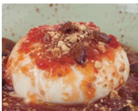
Ensalada de Burrata 11,50 120 gr del corazón de la mejor mozzarella de búfala