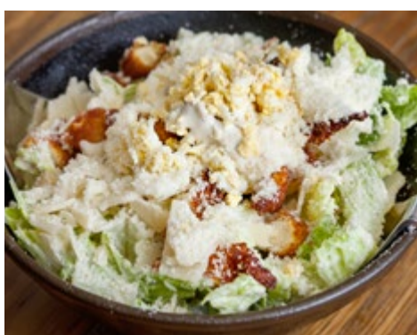
Ensalada Pura César 8,75 Con lechuga, pollo crujiente, queso parmesano, picatostes, huevo duro y nuestra deliciosa salsa