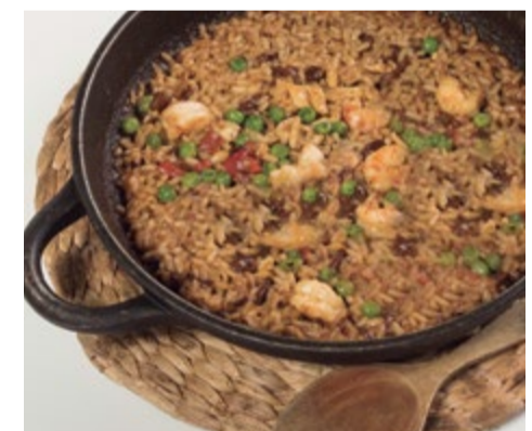
Arroz al carbón 13,85 / pers. Paella señorito a la brasa