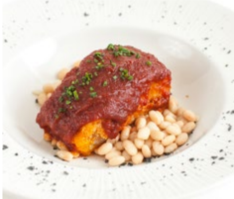
Lomo de bacalao "a la llauna" 14,50 Salteado con ajo, guindilla y tomate