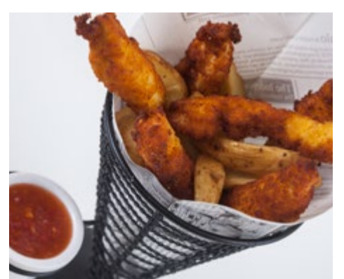
Chicken fingers 8,75 Para los más pequeños