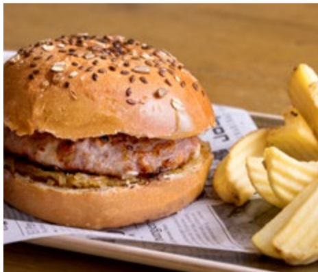
Hamburguesa de payés 10,00 Hamburguesa de cerdo y queso con cebolla y patatas