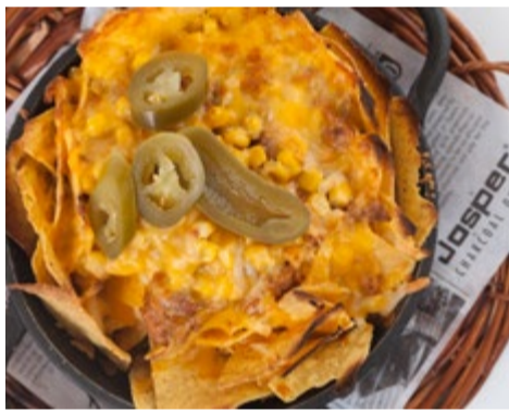
Nachos a la brasa 9,75 Con carne picada, tomate, jalapeños y queso fundido