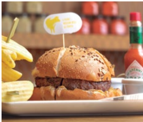
Burger "Wagyega" 13,50 Ternera Rubia Gallega y carne de Wagyu, 225 g