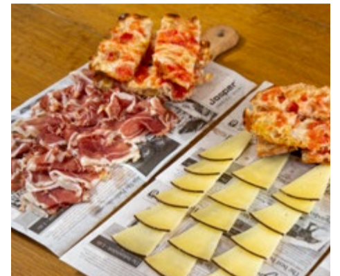
Medias tablas Jamón ibérico y queso de oveja