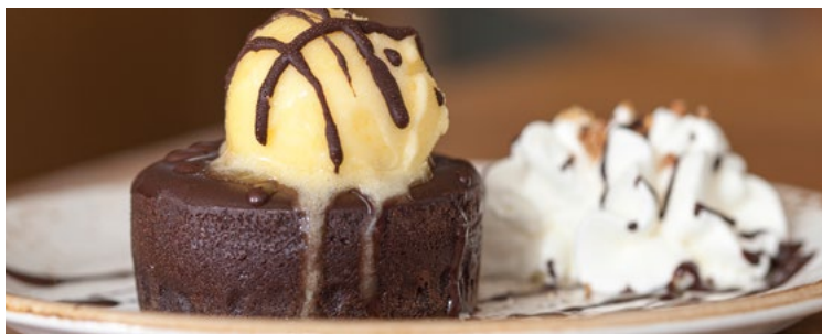
Coulant de xocolata amb cor Rocher 5,50

Bombas de chocolate, totalmente artesanales