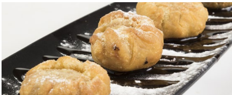
Bombes de xocolata, totalment artesanals 5,00

Pura Brasa et recomana... Pura Brasa te recomienda