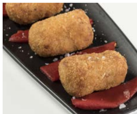
Croquetas caseras 8,85