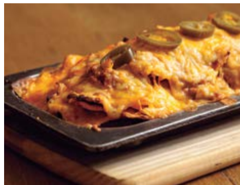
Nachos a la brasa 10,50 Con carne picada, tomate, jalapeños y queso fundido