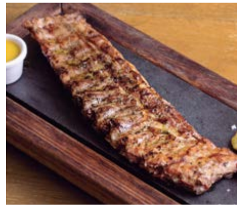
Costillar de cerdo 19,75 Con dos coccciones, baja temperatura 20 h a 75°C y finalizado a 400°C al Jospers®