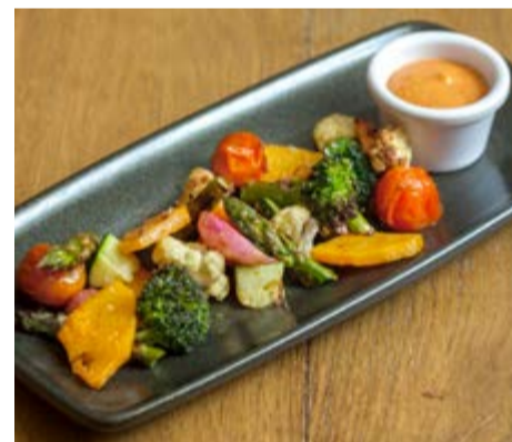
Crudité de verduras 12,50 A la brasa con salsa romesco