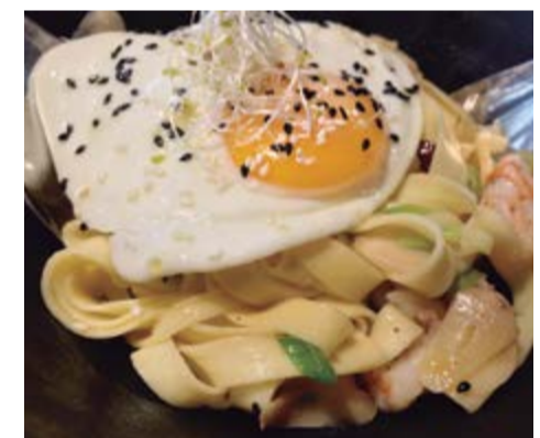
Tagliatelle all'aglio 13,50 Con langostinos, ajo, guindilla y con un huevo frito