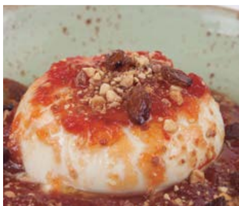
Ensalada de Burrata 14,50 200 g del corazón de la mejor mozzarella de búfala