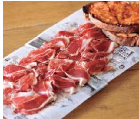
Ració pernil ibèric de gla 21,50 *Les nostres racions se serveixen amb pa torrat amb tomàquet