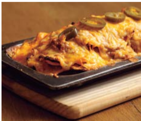
"Nachos" a la brasa 10,50 Amb carn picada, tomàquet, "jalapeños" i formatge fos