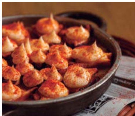
Cassoleta de pop 14,75 Amb una suau mussolina d'allioli i deliciosa base de puré de patata