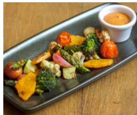
Crudités de verdures 12,50 A la brasa amb salsa romesco