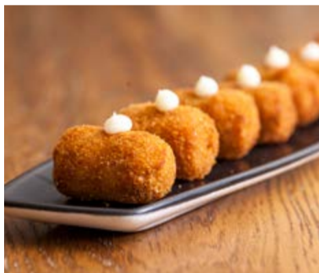
Croquetes casolanes 8,75 Les nostres croquetes casolanes de pollastre i pernil