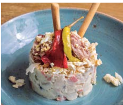
Amanida russa 7,75 Amb maionesa, pèsols, olives, tonyina i ou dur