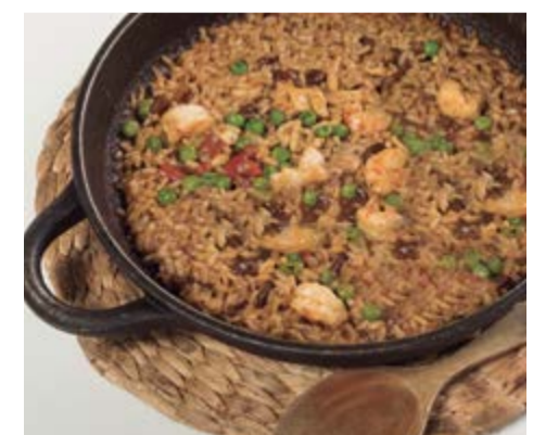
Arròs al carbó 15,25 / pers. Paella senyoret a la brasa