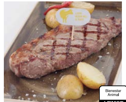
Entrecot a la brasa 19,75 Entrecot a la brasa vedella dues primaveres (suplement de salsa al pebre o roquefort 1€)