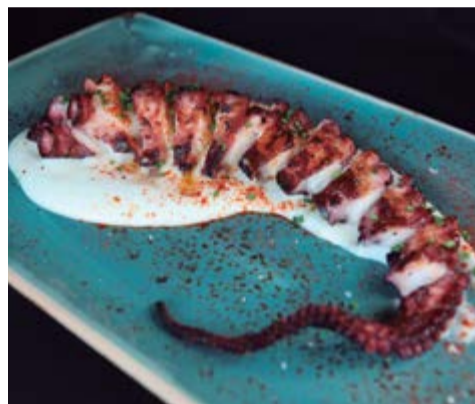
Pop a la brasa 21,95 Sobre parmentier trufat de patata i pebre vermell de la Vera