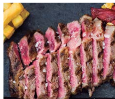
Llom de Wagyu 13,95 / 100g Llom de Wagyu sense os