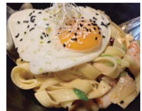
Tagliatelle all'aglio 13,50 Amb llagostins, all, bitxo i coronats amb un ou ferrat