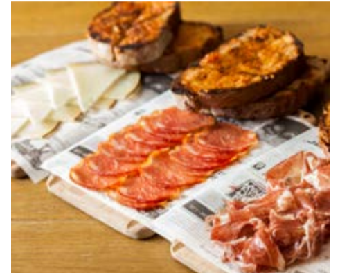
Mitges racions Pernil ibèric, llom ibèric i formatge d'ovella curat