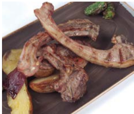
Costelles de xai 7,50 / u. En aquesta casa només es ven costella de pal. Quantes en vol?