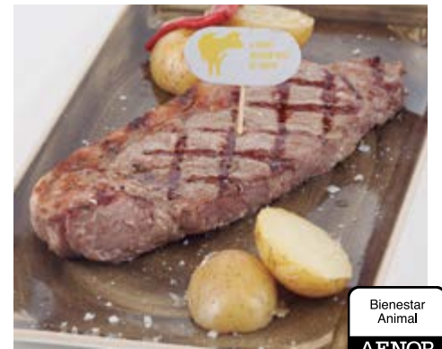
Entrecôte à la braise 19,95 Entrecôte de jeune bœuf braisée Supplément sauce au poivre ou au roquefort 1€