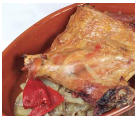
¼ agneau de lait 62,00 Cuit très lentement à la braise