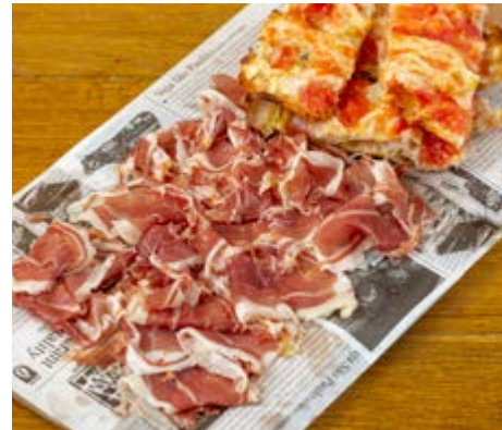
Jambon ibérique de bellota 21,95 *Nos portions sont servies avec du pain grillé et de la tomate.