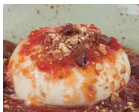
Salade burrata 14,60 200 gr du cœur de la meilleure mozzarella di Bufala