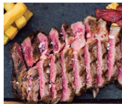
Filet de Wagyu sans os 14,00 / 100gr Filet de Wagyu sans os