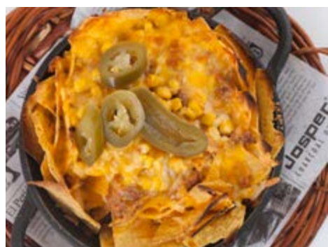
Nachos gratinés 10,50 À la braise avec viande hachée, tomate, piments "jalapeños" et fromage fondu