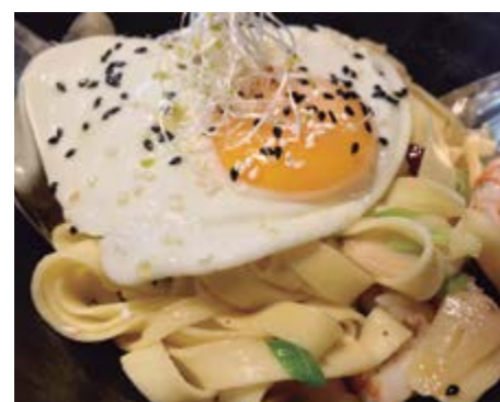
Tagliatelles à l'ail 13,50 Sautées aux gambas, ail et piment, le tout couronné d'un œuf