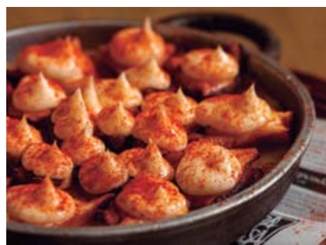
Cassolette de poule à la braise 14,90 Accompagné d'une légère mousse à l'aïoli et d'une délicieuse purée de pommes de terre et paprika fumé