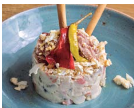
Salade russe 7,75 Avec mayonnaise, petits pois, olives, thon et œuf dur