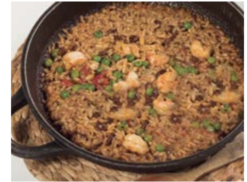
Paella cuite au charbon 15,25 / pers. Paella señorito à la braise (aux fruits de mer décortiqués)