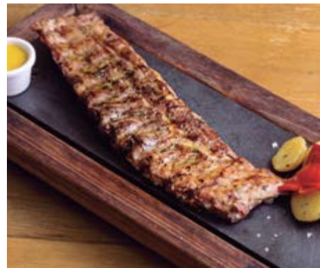
Travers de porc 19,90 Cuit en deux temps : 20 h à basse température à 75° et fin de cuisson à 400° dans notre four à braise Jospers®