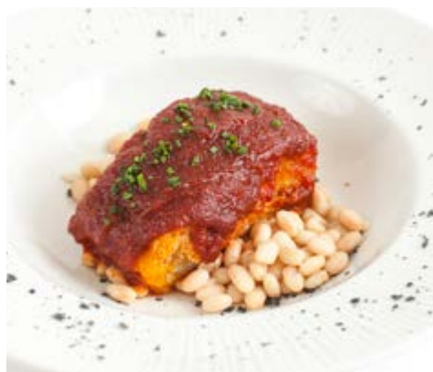
Pavé de morue sauvage 19,75 "A la llauna" (plat en tôle) sauté à l'ail, piment rouge et tomate