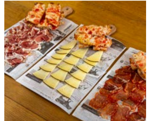
Medias tablas Jamón ibérico, lomo ibérico y queso de oveja