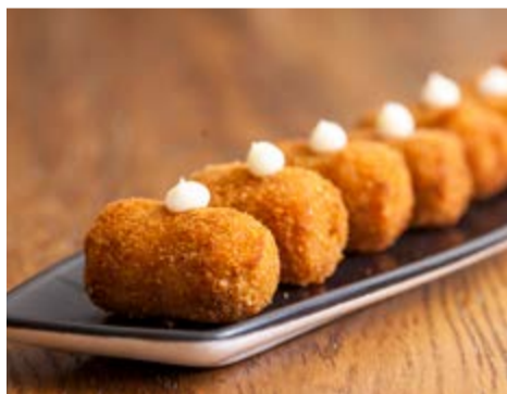
Croquetes casolanes 8,85 Les nostres croquetes casolanes de pollastre i pernil