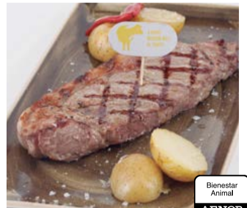
Entrecot a la brasa 19,95 Entrecot a la brasa vedella dues primaveres (suplement de salsa al pebre o roquefort 1€)