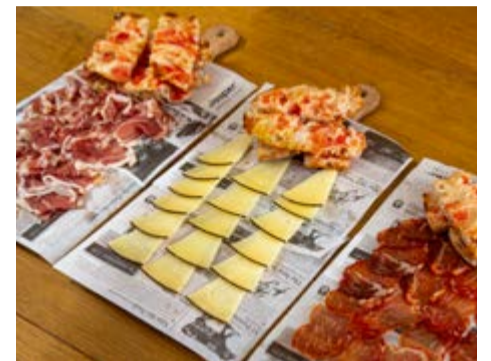
Mitges racions Pernil ibèric, llom ibèric i formatge d'ovella curat