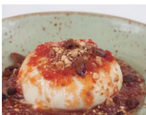
Amanida de burrata 14,60 200g del cor de la millor mozzarella de búfala