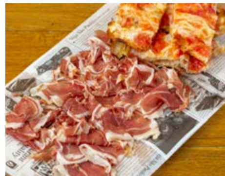
Ració pernil ibèric de gla 21,95 *Les nostres racions se serveixen amb pa torrat amb tomàquet