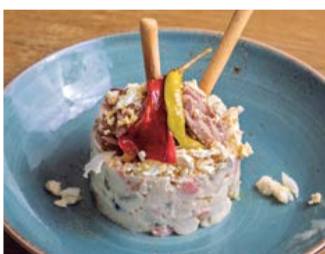
Amanida russa 7,75 Amb maionesa, pèsols, olives, tonyina i ou dur