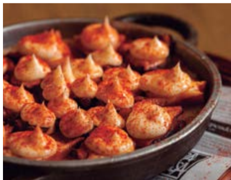
Cassoleta de pop 14,90 Amb una suau mussolina d'allioli i deliciosa base de puré de patata