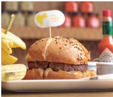
Burger "Wagyega" 15,50 Vedella "Rubia Gallega" i carn de Wagyu, 225 g