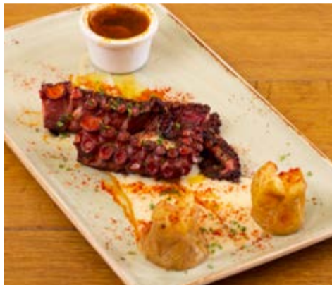
Pop a la brasa 22,25 Sobre parmentier trufat de patata i pebre vermell de la Vera