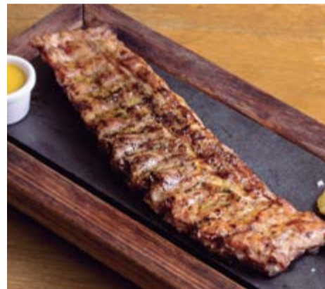
Costellam de porc 19,90 Amb dues coccions, baixa temperatura 20 h a 75°C i finalitzat a 400°C al Jospers®