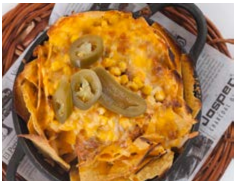
"Nachos" a la brasa 10,50 Amb carn picada, tomàquet, "jalapeños" i formatge fos