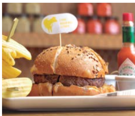
Burger "Wagyega" 15,50 Ternera Rubia Gallega y carne de Wagyu, 225 g