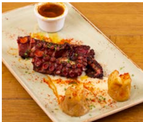
Pulpo a la brasa 22,25 Sobre parmentier trufado de patata y pimentón de la Vera