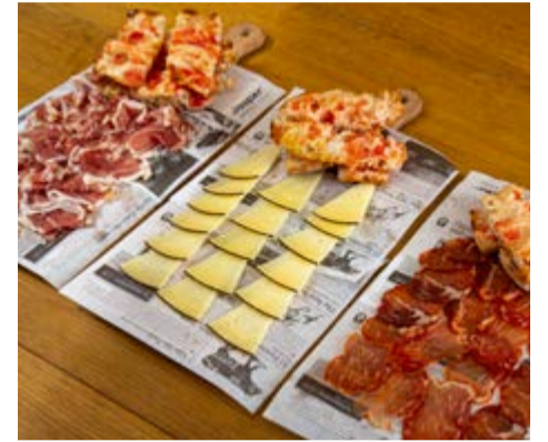
Medias tablas Jamón ibérico, lomo ibérico y queso de oveja