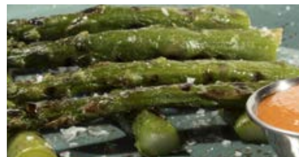
FOTO Espárragos trigueros con salsa romesco PRECIO | 8,95 €